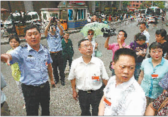
人大代表会诊解放碑交通

断头路碍行、公路变“私路”、部分路段存在安全隐患……素有“中国西部第一街”之称的解放碑中央商务区(CBD),竟有如此多的交通症结。这些问题如同脑血管,梗阻了当地交通发展。为对症下药,昨日,近30位渝中区人大代表与辖区交警一支队民警一道,对该地区交通状况全面把脉,并给出治疗方案。