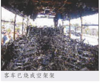
客车已烧成空车架

本报讯 昨日,位于渝北区回兴镇的西南政法大学渝北校区后校门外,一辆由两路开往杨家坪的载客大巴车在行驶中车尾突然冒烟起火,浓烟猛蹿车厢,吓得十余乘客惊恐逃离。尽管消防队奋力救火,但该车仍被烧成光车架。