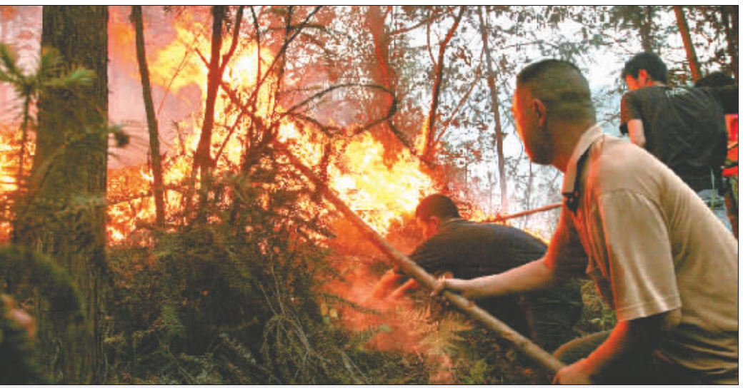
村民们在火场内奋力灭火

夜幕降临,老鹰山蔓延的火势逐渐得以控制。截至昨晚9时30分发稿,火场传来消息,建文峰景区未受火劫,在老鹰山、往界石镇辖区蔓延的火势完全得到控制,已几乎熄灭。