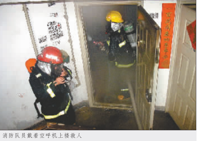
消防队员戴着空呼吸机上楼救人

该楼层共7层,每层4户。很快,4楼以下所有住户全部安全逃离,然而,当5楼两户业主逃离后,浓烟完全封锁了3楼和4楼楼道,伸手不见五指。部分高楼层业主被迫返回家中等待救援。