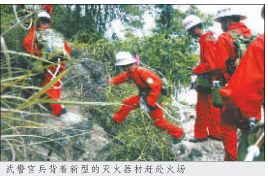
武警官兵背着新型的灭火器材赶赴火场