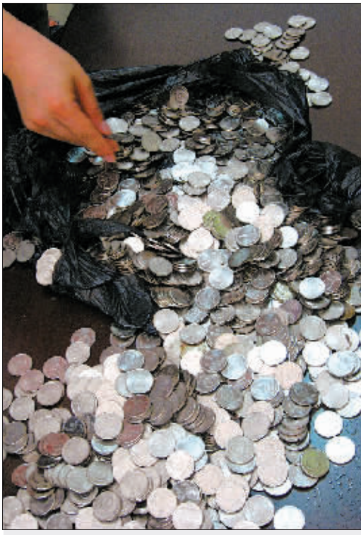
警方缴获的部分假硬币

看图案:真1元硬币的花篮、稻穗、国徽、天安门等图案清晰,凹凸感强,正反面图案朝向一致;而假币则制作粗糙,图案模糊,边缘没有斜体字符组“-RMB-”,正反面图案朝向不一,显得正反不对称。 摸边沿:真币厚薄均匀、平滑,而假币则通常厚薄不均,边沿时有切割、磨痕状。 辨材质:真1元硬币为镍包钢,用磁铁可以吸起,否则肯定是假币;另外很多假1元硬币用铝或铝,将其向白纸上画,会出现铅笔线一般的清晰痕迹。 叠放比较:真1元硬币叠放在一起时非常平整,但假币由于厚薄不一致,夹在真币中叠放,会产生不协调的感觉。