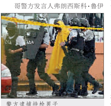
警方逮捕持枪男子