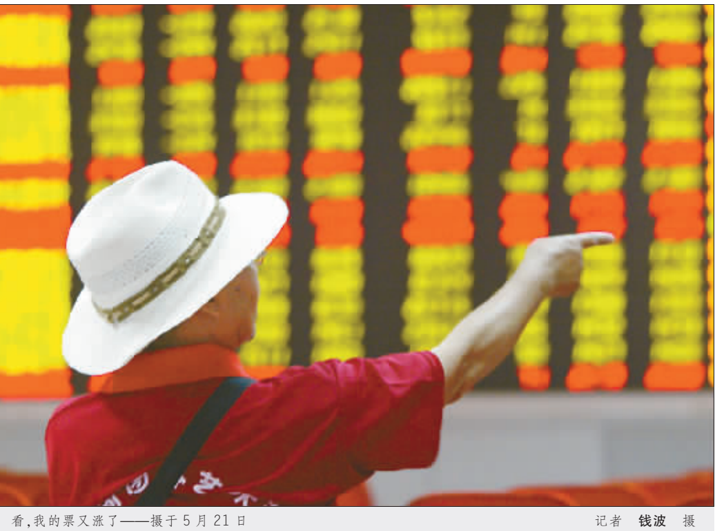
看，我的票又涨了——摄于 5 月 21 日

分别增长 45.03% 和 34.27%。 长安铃木的羚羊、雨燕系列轿车的排量则位于 1.0L-1.5L 之间，消费税下降 2 个百分点。从政策环境来看，自主开发和鼓励小排量汽车是公司面临的两大机遇，特别是国家六部委联合下发的《关于鼓励发展节能环保型小排量汽车的意见》，取消了各地对小排量汽车在行驶线路和出租汽车运营等方面的限制，对公司发展微型车、经济型轿车等节能型产品提供了大好的机遇。 该股作为博时基金的重仓股，在 3 月份之后表现严重落后于大盘。而博时基金在国内一直被贯以王牌基金的称号，影响力一度和广发、易方达等相当，但近期重仓股却表现一般。此次能否凭借汽车股绝地反击？值得期许。 二级市场上，该股股性其实汽车股里最为活跃的一个，要不不爆发，一旦爆发便直指涨停！从 K 线看，目前 5 日、10 日、30 日、60 日等短中期均线全部向上发散，KDJ、MACD 等指标也呈现买入信号。 华龙证券