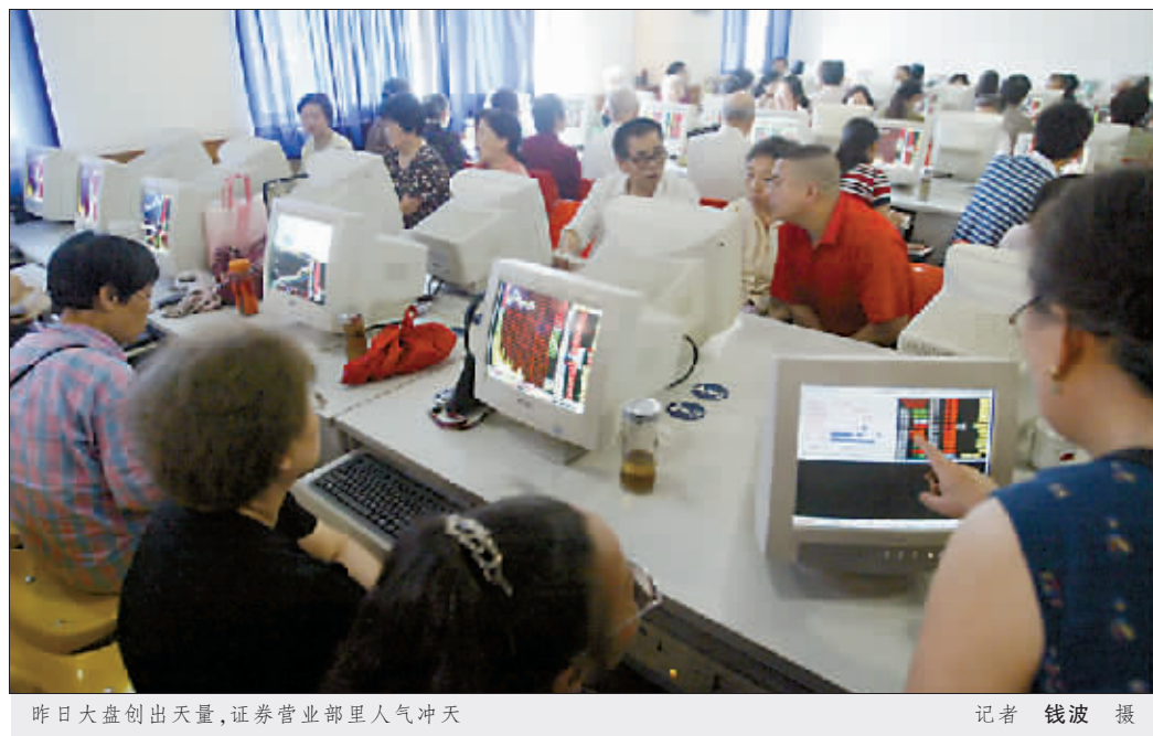
昨日大盘创出天量,证券营业部里人气冲天

消息人士表示,目前各方主管机构已达成改变个人账户资金管理模式的共识,将效仿企业年金的运作方式,委托专业机构进行资产管理,资金投资工具将适当拓宽,债券市场和股票市场都将成为新的投资渠道。 权威人士证实了以上说法,并指出,个人账户毕竟是社会保障的第一支柱,其投资工具和投资策略的选择都会更加谨慎。同时可以预期的是,由于作为社会保障体系中第二支柱的企业年金采用了金融机构“选秀”方式,相信获得个人账户资金的投资管理权需要通过更为严格的挑选。 中国社科院拉美研究所所长郑秉文判断,目前我国基本养老保险资金约为370亿元左右。 中国证券报