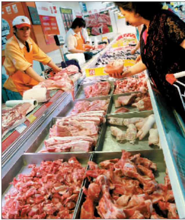
近期国内市场猪肉价格上涨

由于超市猪肉涨幅低于农贸市场,不少原本在农贸市场买肉的市民纷纷改到超市买肉。家乐福介绍,这段时间,其猪肉销售大约增长两成。新世纪也称,虽已进入炎夏,但其猪肉销量一直看涨。 记者 陈斌