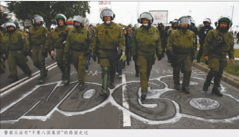
警察从涂有“不要八国集团”的路面走过