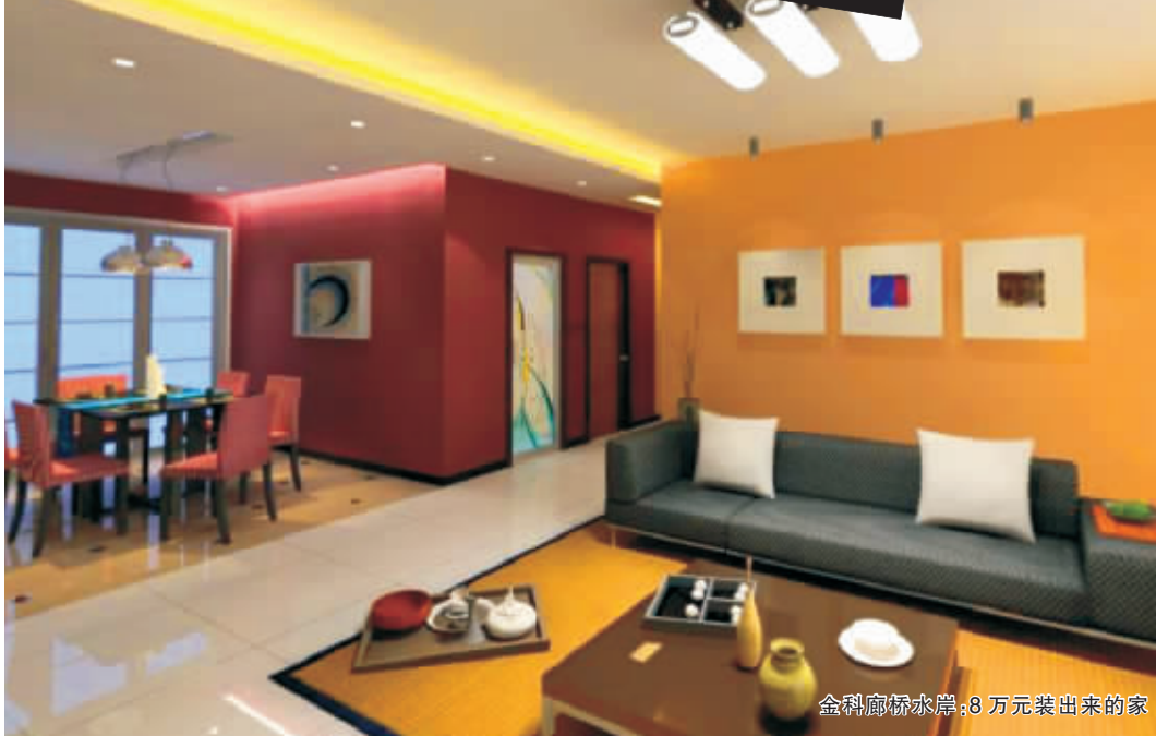
金科廊桥水岸，8万元装出来的家

设计理念：不管现代、中式、欧式，均应体现出业主的品位和实际需要。房屋的功能性、景观的丰富性、变化性与多样性，室内装饰应该是品位和思想的延续，把握每一个细节，在不断的创造和颠覆之间游走，为的只是让生活充满情趣。