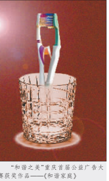
“和谐之美”重庆首届公益广告大赛获奖作品——《和谐家庭》