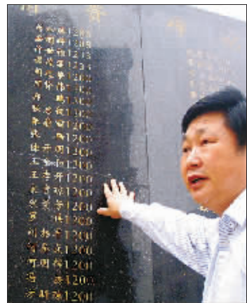
纪念碑记下民众的意志