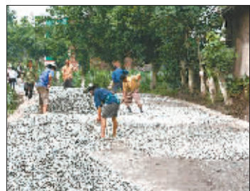
在朱沱，修路是民间的一种力量