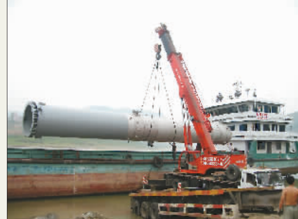
三聚氰胺设备吊装现场