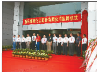
股份有限公司挂牌仪式

从四十一年前人烟稀少、杂草丛生的偏僻荒山,发展成为矗立在乌江水岸现代化的美丽城镇;