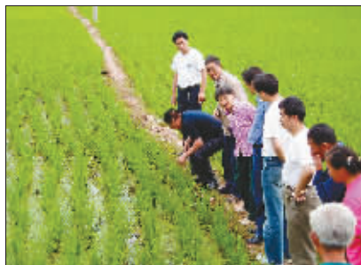
技术人员开展农化服务

建峰历经两次艰苦创业,为企业做大做强奠定了坚实的基础。而借壳上市,无疑是在第三次创业中再一次积蓄力量,实现了企业跨越式发展。