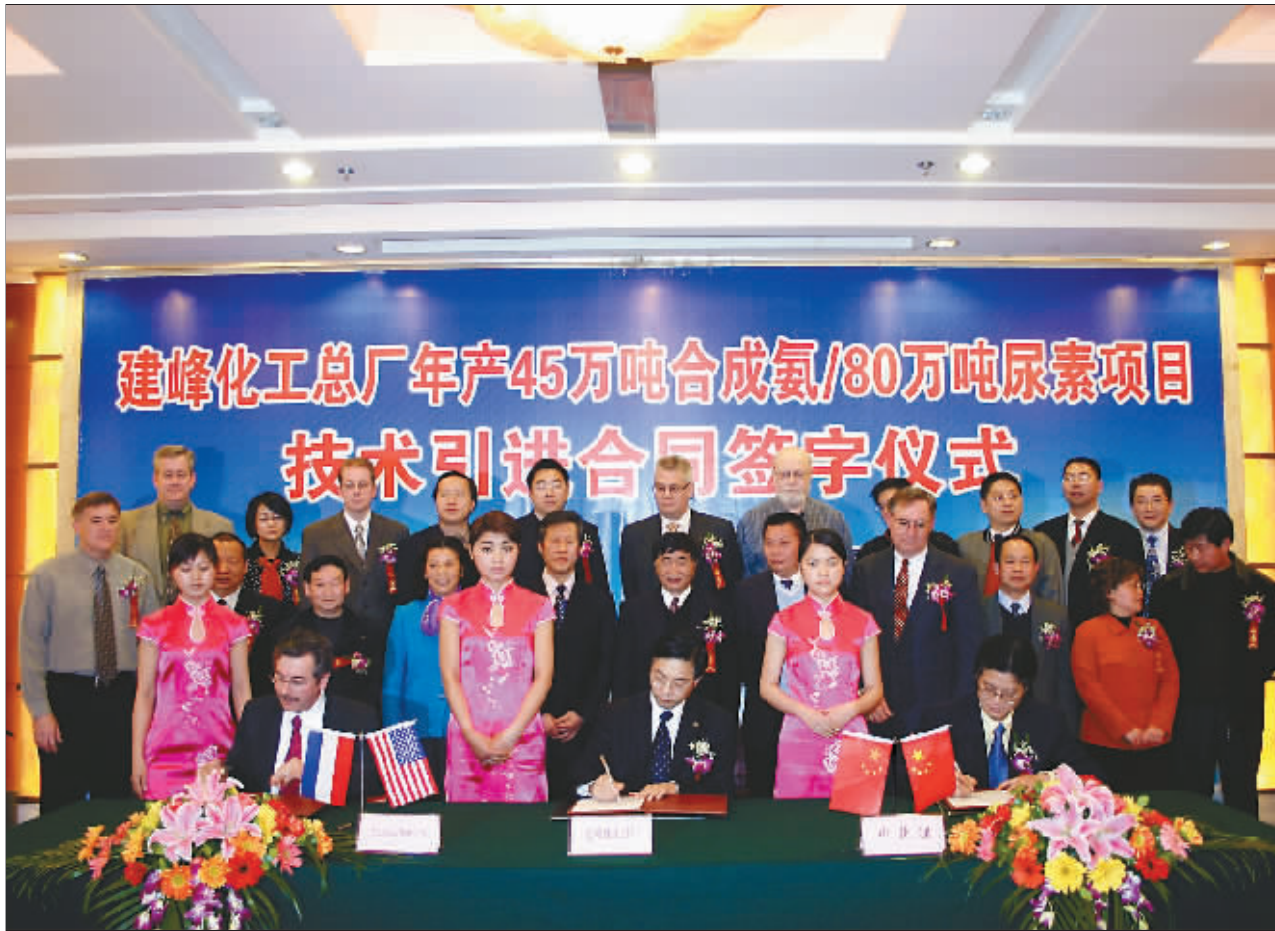
建峰化工总厂年产45万吨合成氨/80万吨尿素项目 技术引进合同签字仪式

作为四大支柱产业之一,重庆市构筑的天然气化工发展新蓝图中,100亿化肥工业园区项目在涪陵白涛启动,在该蓝图中处于核心地位的建峰化工总厂志在打造全国一流的化肥生产基地和重庆市举足轻重的化工龙头企业。建峰化工总厂4月中旬与有关方面签订设计合同,总投资52亿元,年产45万吨合成氨/80万吨尿素项目目前已开工建设;同时该厂先期启动的年产6万吨的三聚氰胺项目也已进入设备安装调试阶段。45万吨合成氨/80万吨尿素项目建成投产后可新增年销售收入107亿元,利税25亿元,被定为重庆市直辖十周年十大工业献礼项目。