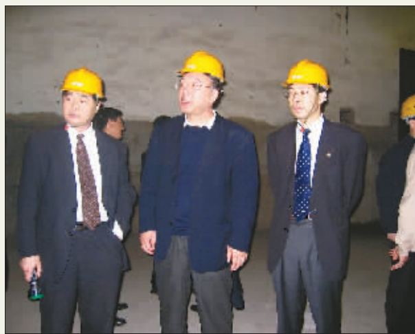
黄奇帆副市长到建峰化工检查工作

仅仅是建峰化工新增“大化肥”项目,其建成后的产量达130万吨以上,这无疑是在涪陵化肥基地的重要依托。据了解,“白涛化工园”就是充分利用建峰化工总厂土地存量和生产要素资源,有利于加快形成以尿素、三聚氰胺、氯碱为核心的产业体系,在提升产品竞争力的基础上延伸产业链条,有利于加快园区基础建设,促进园区公共产品平台建设,提高配套能力及相关资源的综合利用率,壮大园区规模,增加就业和税收,实现规模经济和循环经济的良性互动,形成以建峰化工总厂为核心的特色工业园区,建成长江上游的化肥基地和我国最大的磷、氮肥生产基地。