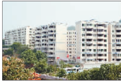
风景宜人的住宅小区