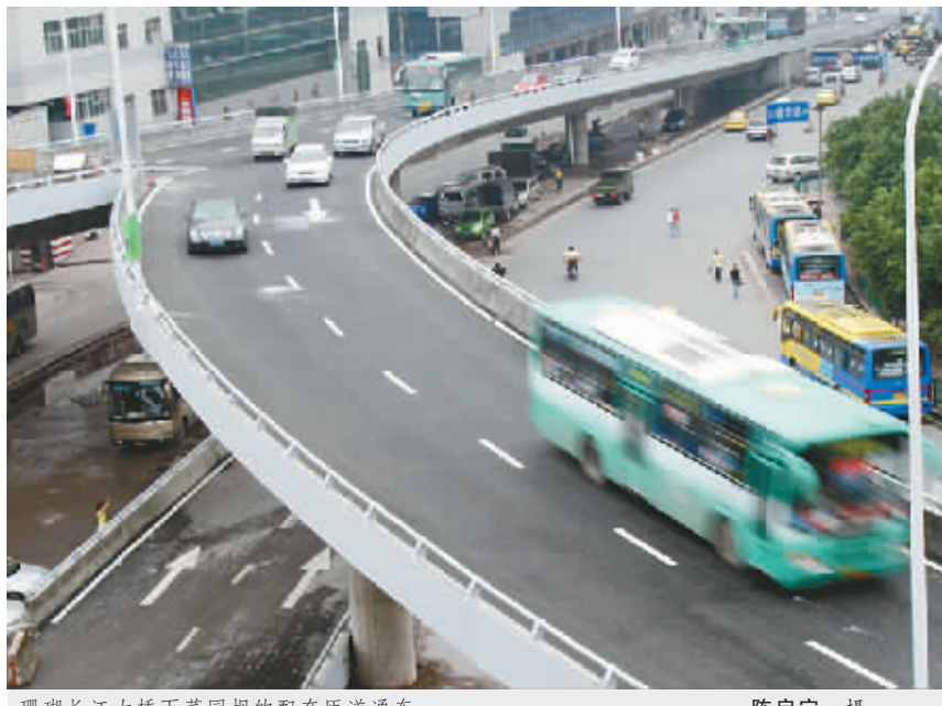
珊瑚长江大桥下菜园坝的配套匝道通车