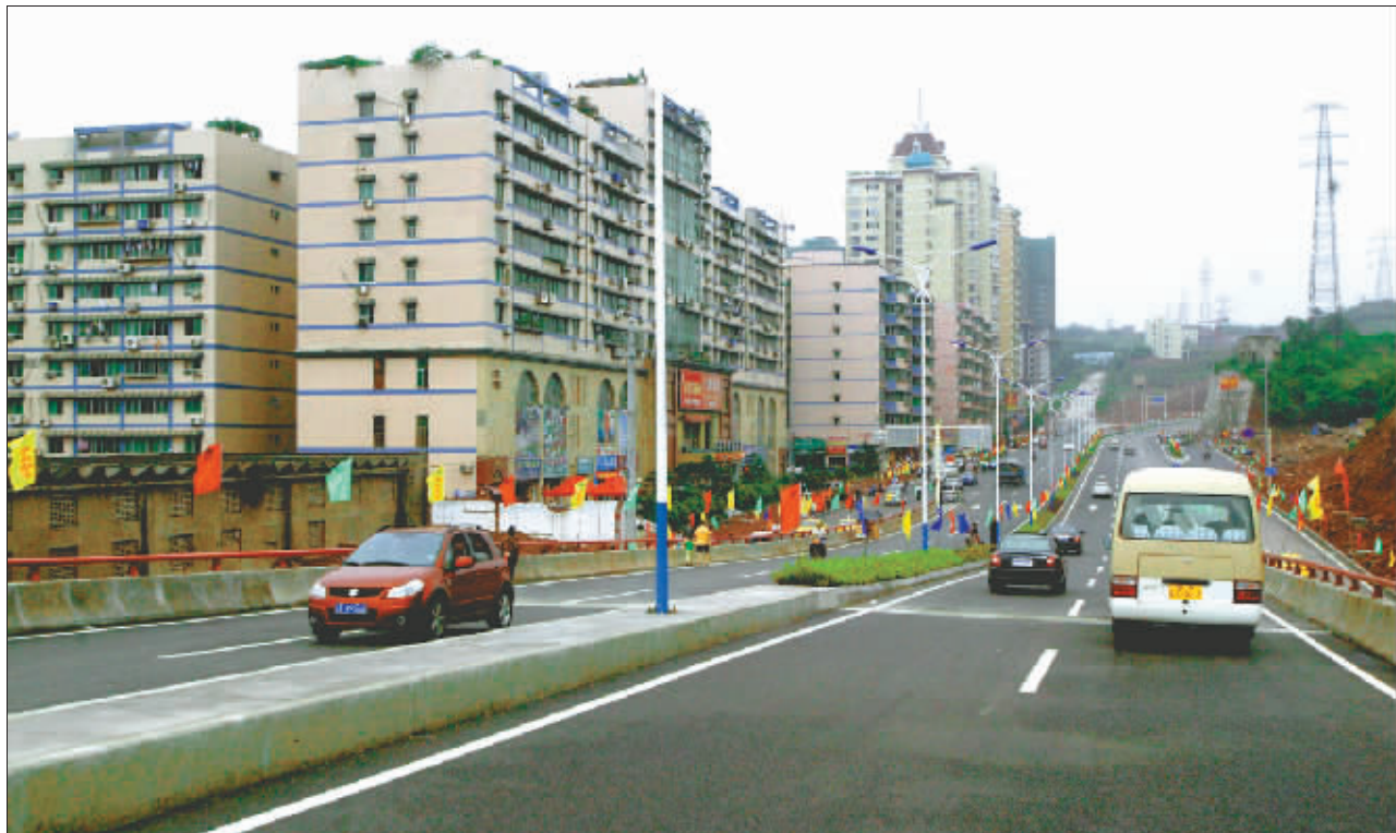
高九路的通车将给沿线带来发展