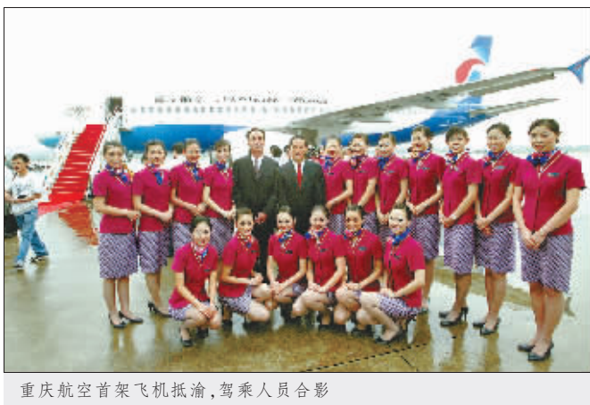
重庆航空首架飞机抵渝，驾乘人员合影