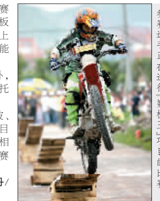
参赛选手正在进行“翘翘板”项目的比赛

既是比赛就难免出意外。21号赛手冲上第3块翘翘板时,车身突然从板上坠落,重重摔地。工作人员立即上前,扶他出赛场。解说员称,赛手可能脚受伤。比赛继续。昨下午的挑战赛除过翘翘板外,还有过起伏路段的比赛,赛手驾摩托车活像在冲浪。