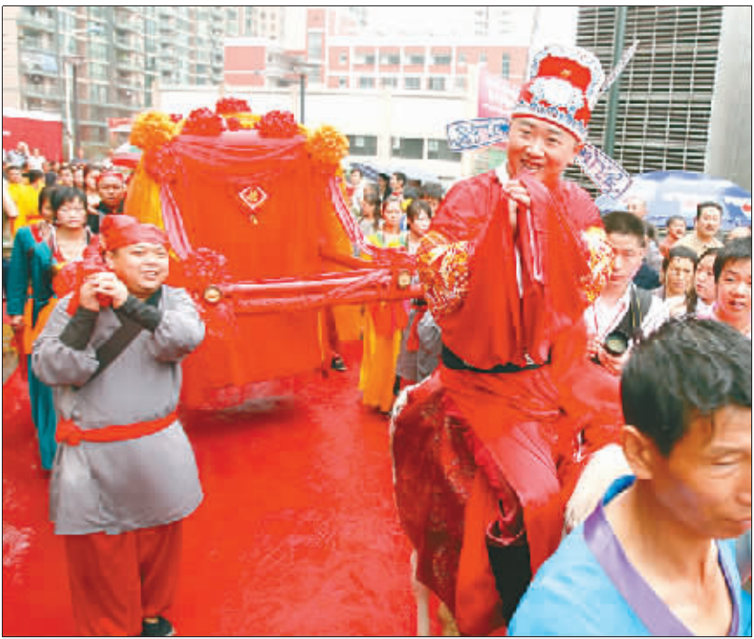
新郎含笑谢四方客人

第一时间 第一资讯 晚报 第一现场 爆料热线 966988 dsb@mail.cqwb.com.cn