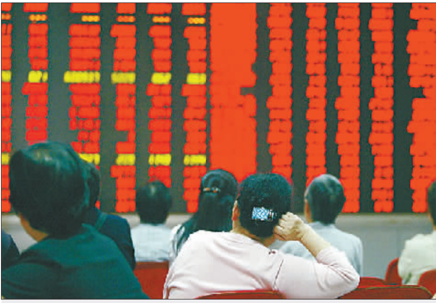
19 日,沪指逼近前期高点,众股民静观动向。

多位业内人士均认为,该消息出现在股市短期内的政策真空期,以及市场在短暂调整后的又一轮强劲上涨之时,信号意义十分明显。深圳特区报