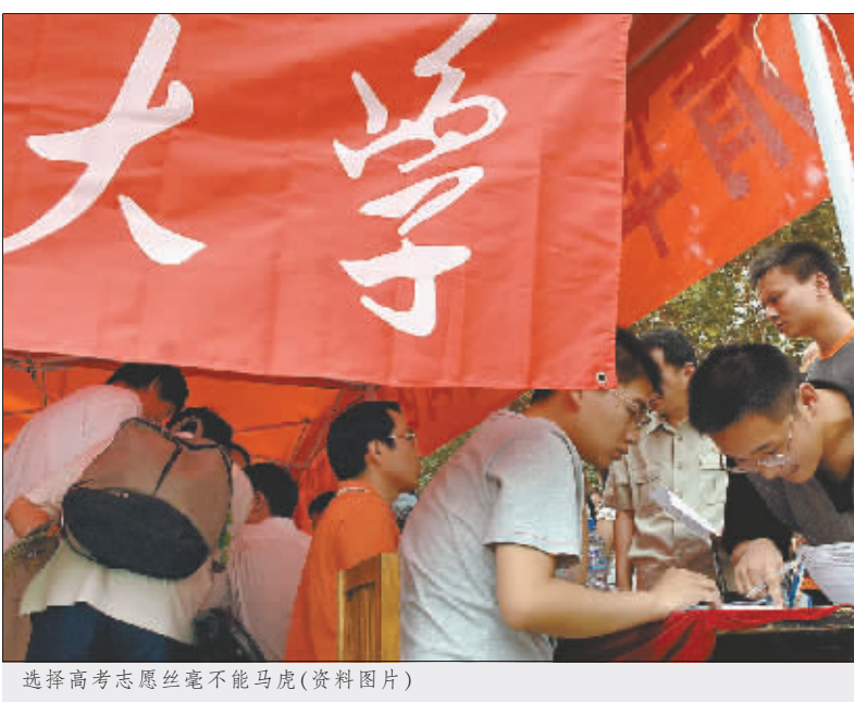
选择高考志愿丝毫不能马虎(资料图片)

其次,所有考生中,本科第一批13198名计划中,文科2106名,理科11092名;本科第二批24476名计划中,文科7828名,理科16648名,占27.9%;本科第三批9201名计划中,文科3645名,理科5556名,占10.5%;高职(专科)提前批823名,文科332名,理科491名,占0.9%;高职(专科)第一阶段10672