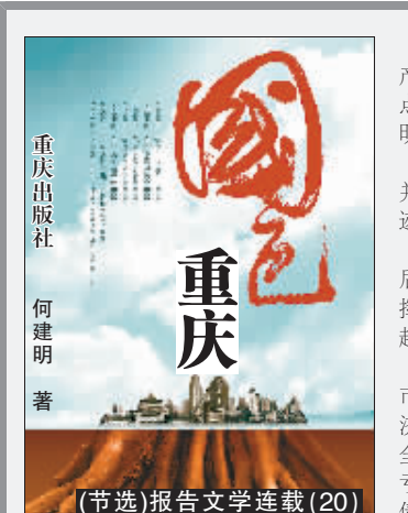
何建明 著 (节选)报告文学连载(20)

生命是脆弱的，正因为有了人与人之间那么多的牵挂和关怀，生命才变得如此厚重。一份善意的自欺，换得一份自我的甜蜜，让自己浸润在三月的和风里，为心灵寻一个避风的港湾，何乐而不为呢？我们固然不能脱离现实而存在，但如若连那一份自欺的情致和欢乐也失去了，实在是一件不幸的事。