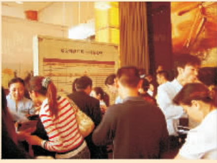
开盘当天现场火爆销售情况