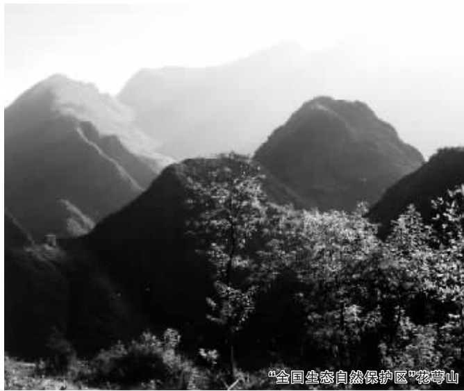
“全国生态自然保护区”花萼山