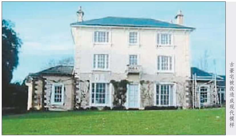
古豪宅被改造成现代模样

据英国《泰晤士报》7月5日报道,英国商人安德鲁·哈兹尔在购得一幢16世纪古宅之后,按照自己的喜好即进行大规模改造。日前,当地市政规划部门发现这幢价值200万英镑的历史建筑被改得面目全非后,责令哈兹尔交纳罚款,并赔偿50万英镑,以便将受损古建筑“还原”。