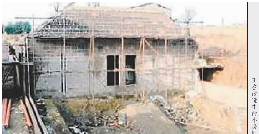
正在改造中的小房间

哈兹尔的邻居痛心地说:“这幢带有精美花园的古宅,数个世纪以来一直都是这一带的标志性建筑。如此大规模改造,简直就是一种亵渎。” 明天