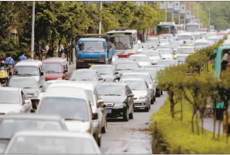
高峰时期车辆堵成了长龙(资料照片)

今年上半年我市交通情况统计显示:交通堵塞时有发生,驾驶人交通违法行为突出,引发交通事故比例上升。针对这些问题,市交警总队昨日发布消息:从今日开始,将集中整治交通秩序突出问题,预防交通事故,确保道路安全畅通。