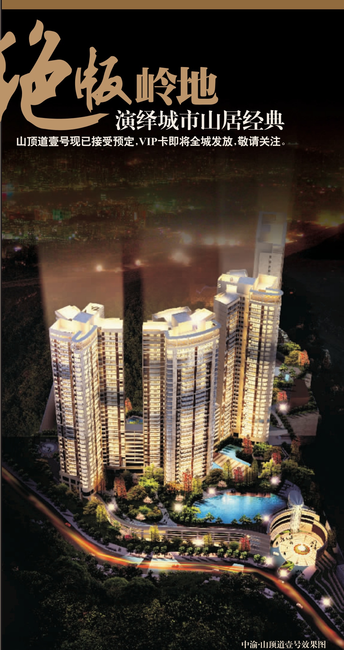
中渝·山顶道壹号效果图

贴合舒适、健康、宜居的现代居家理念，山顶道壹号的户型以舒适的两房、三房为主，面积60-131平方米。在项目的整体布局上，充分利用地