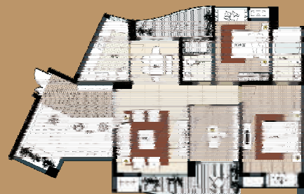
2007最佳舒适户型奖 套内面积约:109m 2