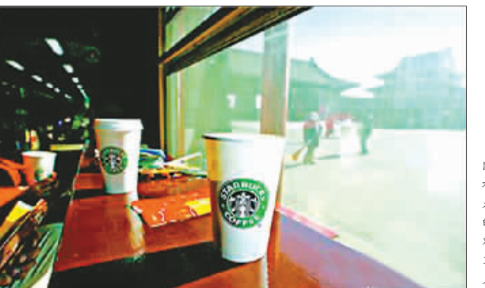
星巴克停止在故宫营业

2006年通过邀请招标的方式选择了一家具有国际背景、经验丰富的专业公司,委托其对故宫的经营网点进行规划,以此来提高故宫的整体服务水平。