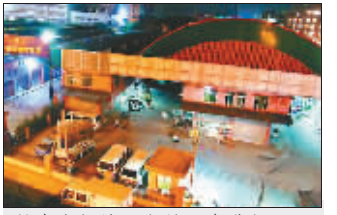
批发市场地下交易正在进行