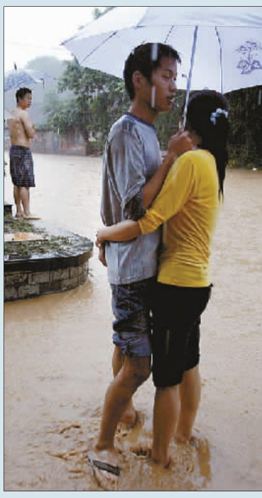
一对情侣相互拥抱,用爱抵挡暴雨