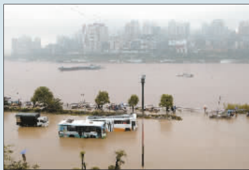
南滨路淹没了