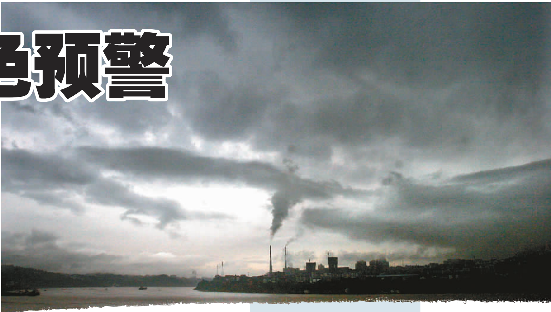
强气流笼罩主城上空

前天白天到昨日傍晚,主城核心区域雨量达到惊人的266.6毫米——一个突破气象历史记录数值,超过了200毫米的特大暴雨定义。