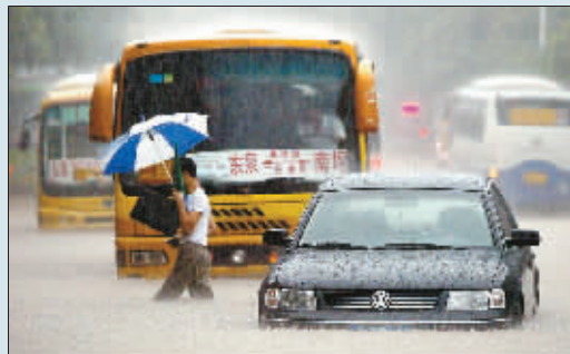
邮电学院附近公路成河