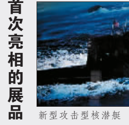
新型攻击型核潜艇