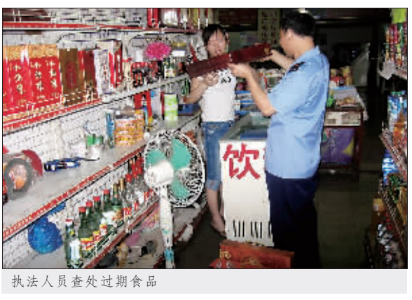
执法人员查处过期食品

菜园坝工商所昨日现场进行查处 “菜园坝一些超市在卖过期食品，市民花钱买了根本不能食用。”昨日，市民聂先生向本报投诉。记者调查发现，这里部分商家将过期食品公开摆上柜台销售，有的食品过期已达一年之久。 本月初，聂先生路过菜园坝火车站，在通发地下商场内一摊点，购买了几个怪味胡豆和豆干。当时，他没有对产品多加留意。上车后，聂看到怪味胡豆包装破旧，于是看了一下生产日期，不看还好，一看吓了他一跳。这袋怪味胡豆是2005年7月31日生产，保质期12个月，过期已经快一年了。聂又拿起旁边一袋豆干，保质期到2006年3月1日，同样也已过期。 根据聂先生反映的情况，记者昨日以旅客身份，来到菜园坝通发地下商场调查。在一家名为“民工平价超市”的门市内，记者发现由广州市特贤食品公司生产的“豆腐西施”豆干，包装封口处标明的生产日期是2006年8月19日，说明中保质期期为低温避光下6个月，已经过期近3个月。但商家却将其摆在柜台显眼处。“这都过期了，怎么还在销售？”售货员看了看说：“没事，过期时间又不长，我们平时也吃，不会有事的。” 在另一家名为“鸿发平价超市”的摊点，记者拿起一盒“氨基酸口服液”，上面的生产日期是2005年9月18日，保质期为12个月，到现在已经过期十个月。 “过期快一年了，还能吃吗？”店老板若无其事地回答：“这个都是密封的，过期一段时间没什么问题。如果你要买，可以便宜一些。”该柜台上，记者还看到一盒名为“鹿茸洋参大补酒”的产品，生产日期是2006年1月2日，同样已经过期，产品包装盒内还有飞蛾“寄居”。 昨日下午，菜园坝工商所根据记者反映的情况，对上述几家超市进行了突击检查，将过期食品进行了没收，并要求商家次日到工商所接受处理。 菜园坝工商所副所长刘伟表示，如果发现经营户故意销售过期食品，他们将对其处以最高3000元的罚款。