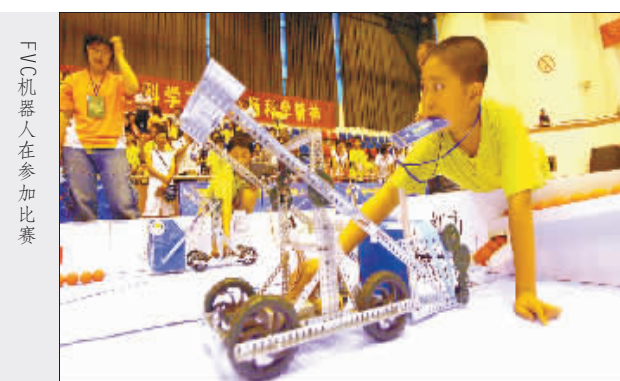
FVC机器人在参加比赛