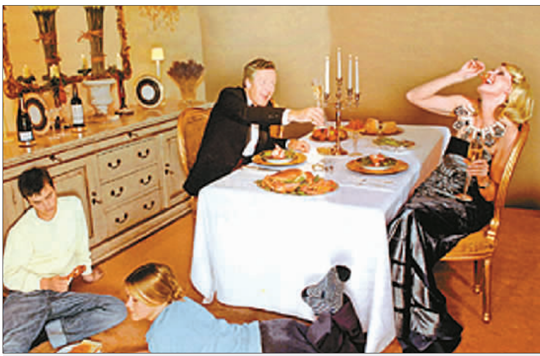
英国的“婴儿潮”一代习惯享乐,他们的下一代都负担沉重

洛杉矶罗马天主教会14日和500多名遭受神职人员性虐待的受害者达成庭外和解协议。教区将支付6.6亿美元赔偿金,摆平这桩丑闻官司。目前,协议尚未正式签订。如果协议得到法院和当事人认可,本案赔偿金额将创下美国教会性虐待丑闻赔偿金额的新纪录。