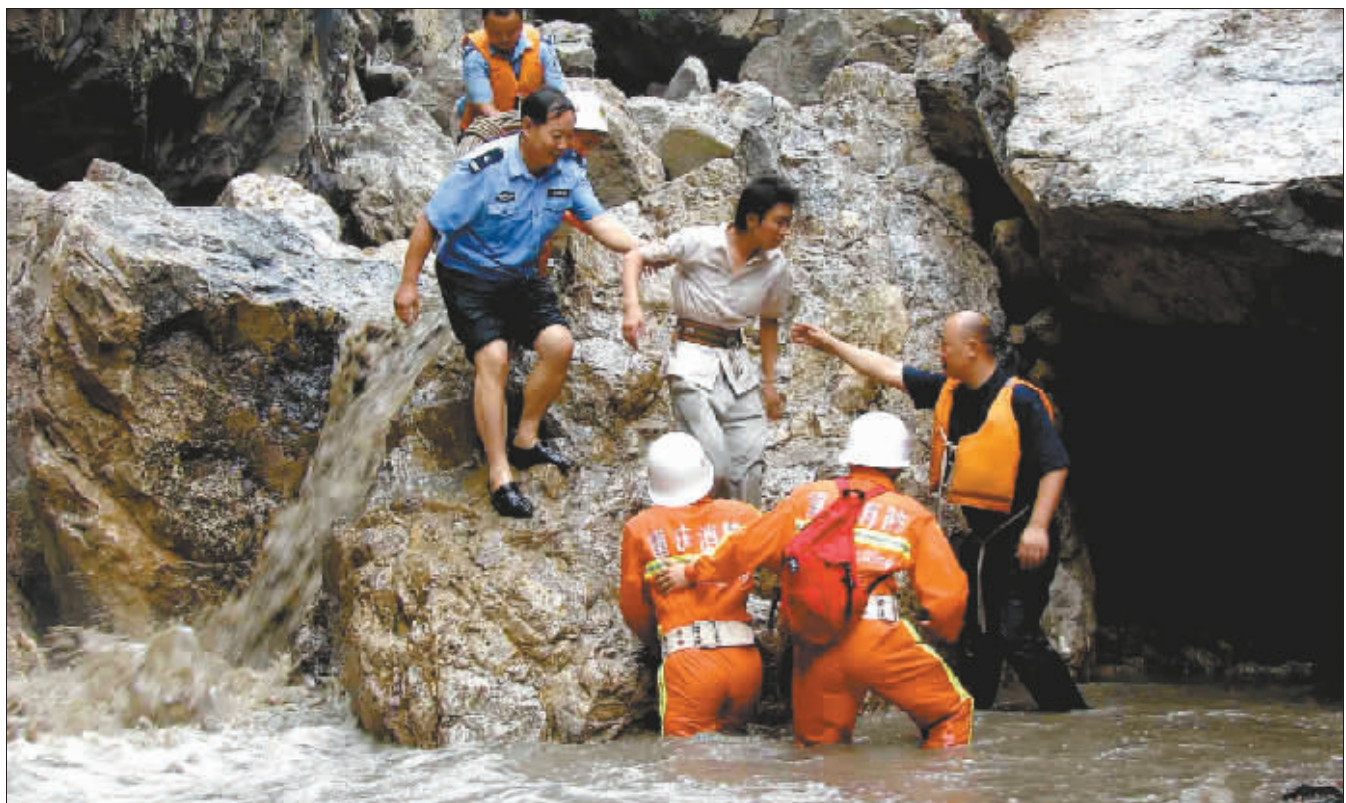
消防官兵从30米高绝壁救下被困大学生

第一时间 第一现场 晚报 爆料热线 966988 dsb@mail.cqwb.com.cn