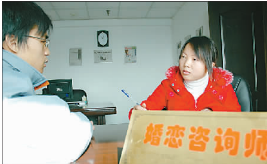
婚姻咨询师询问来访者并做记录