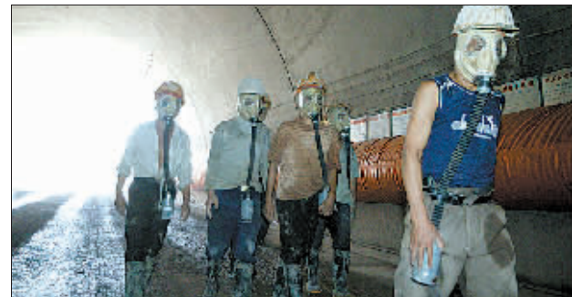
工人戴防毒面具进入隧道