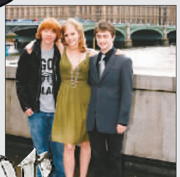
《哈利·波特5》时期，丹尼尔(右)成了小矮人。