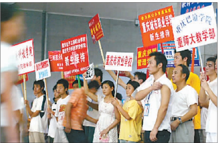
面对类型各异的牌楼学校,学生们还是应多个心眼

在火车站的出站口,记者注意到,10多家接新生的学校高高地举起牌子等候新生到来。每趟火车一到站,接生人员趋之若鹜,堵得出站口水泄不通。