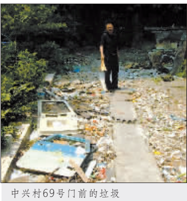
中兴村69号门前的垃圾

谈到如何解决这些问题,余说,除了加大设施设备的投入,也将加大监管力度,督促小区物管及时清除垃圾。今年7月,国家对垃圾的清扫、运输、处理实行市场准入制,清洁公司必须有相应资质才能处理垃圾。环卫部门也逐步向社区延伸,以评选先进社区和示范社区等奖励机制调动社区保洁的积极性,并配合宣传,请市民一起来营造干净的城市环境。(记者 陈静 摄影报道)