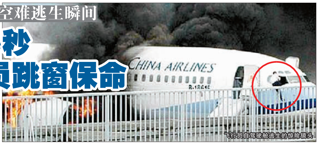
飞行员自驾舱逃生惊险镜头