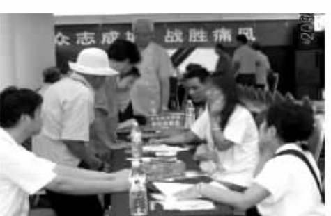
众志成城 战胜痛风

我国痛风发病率及致残率越来越高,重庆因其特殊的地理环境及饮食习惯嗜饮啤酒的饮食习惯成为国内痛风高发区。 治疗痛风,普兰特十味乳香胶囊是比前痛风药中能更有效拔出“酸钉了”(尿酸结晶),恢复肾脏自主排泄功能的OTC成药。经众多患者验证有很高的有效性和安全性,对痛风的疗效显著。 治疗痛风,普兰特十味乳香胶囊是比前痛风药中能更有效拔出“酸钉了”(尿酸结晶),恢复肾脏自主排泄功能的OTC成药。经众多患者验证有很高的有效性和安全性,对痛风的疗效显著。