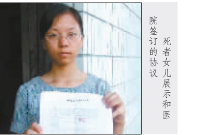
死者女儿展示和医院签订的协议

成都市房管局显然不欢迎“深圳炒房团”的到来，一听说记者来采访“深圳炒房团”的话题，该局工作人员马上摇头婉拒，称不希望有人炒作成都的房价。此外，成都还加大经济适用房房源的放量。成都一位资深媒体人分析认为，这显然是为阻击炒家，以免成都变成当年海南一样的“房价特区”。