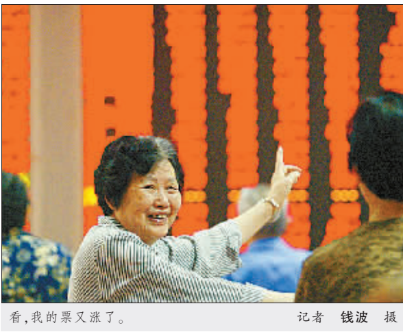
看,我的票又涨了。

股自进入8月下旬以来,一直处于调整之中。在上一段时期的上升行情中,其表现明显落后于大盘,有很强的补涨要求与较大的补涨空间。到昨天,工行、招行、万科等一批大盘权重股跌破了20日均线,返身站上的意愿尤其强烈。客观地讲,大盘指数的表现目前大盘少有的还有较好投资价值的板块之一,它们的上升能得到市场各方的认可。所以,预计今日大盘权重指标股会有比较好的表现。 应对: 密切关注盘中变化,适当介入大盘权重指标股,快速快出。 志析