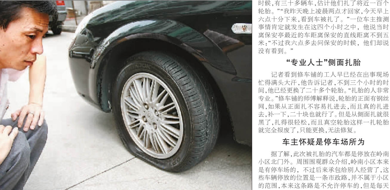
业主怀疑停车场是幕后黑手

据广州日报今日消息 昨天凌晨,停放在广州市岭南小区北门的30多辆汽车的车胎被人用利器刺破。这些车辆都为岭南小区业主所有,据车主初步计算,更换这些轮胎花费可能在4万元以上。目前,警方已经介入此事。