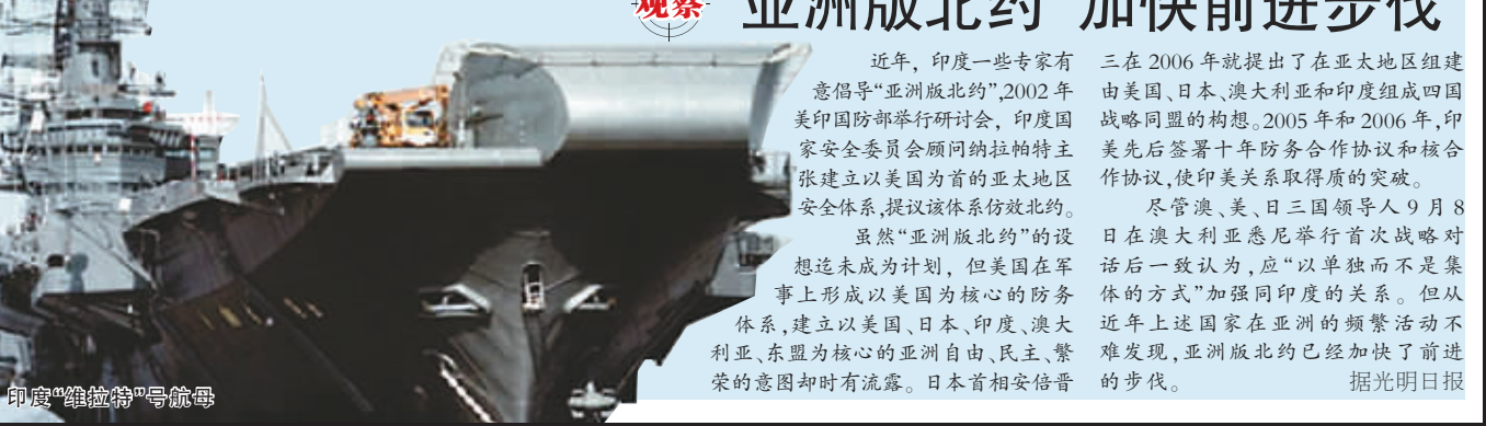
印度“维拉特”号航母