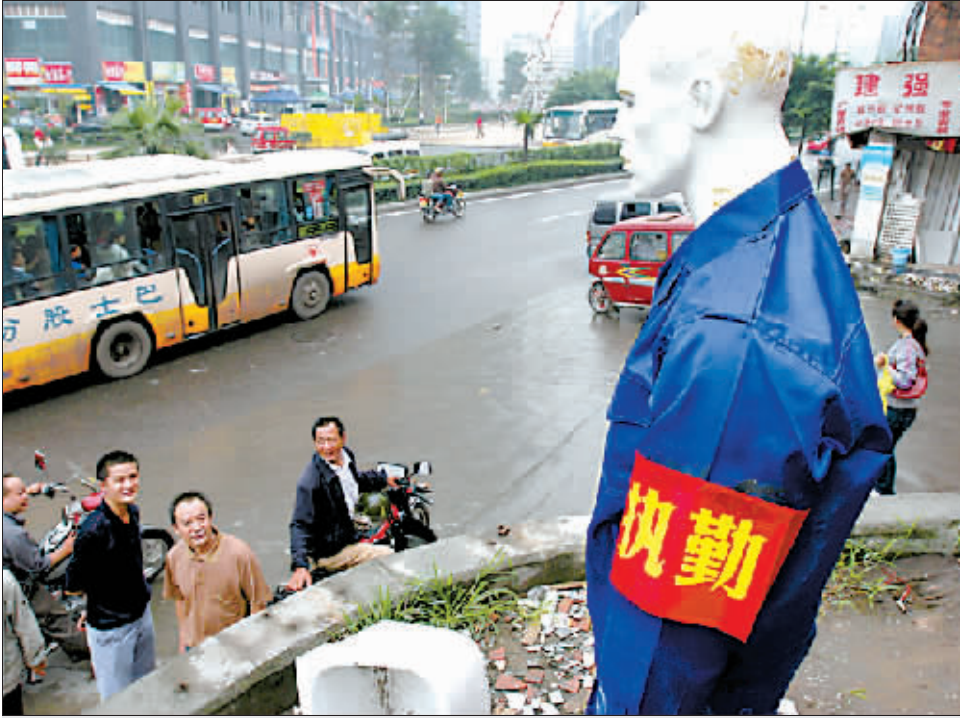
过往市民对这个戴着“执勤”袖章的塑料模特感到很新奇