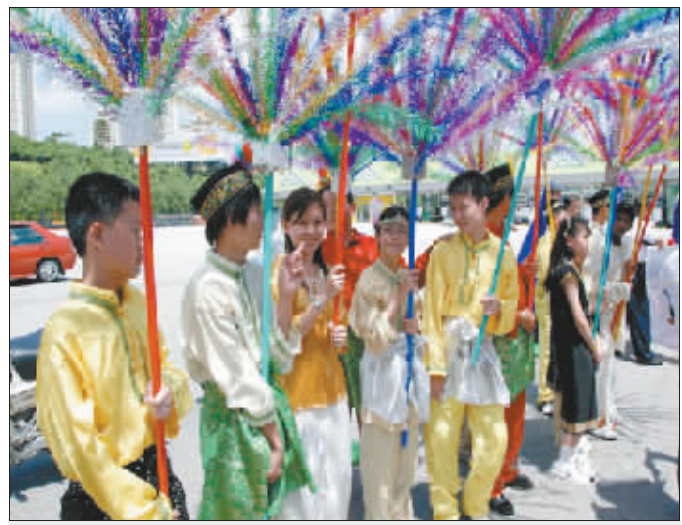
穿着各色花衣服迎接外宾的马来西亚男孩 (资料图片)