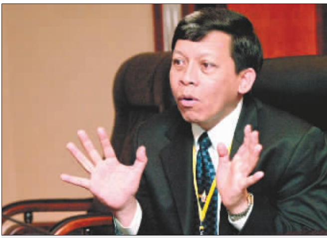
苏拉普表示愿为渝企撑腰