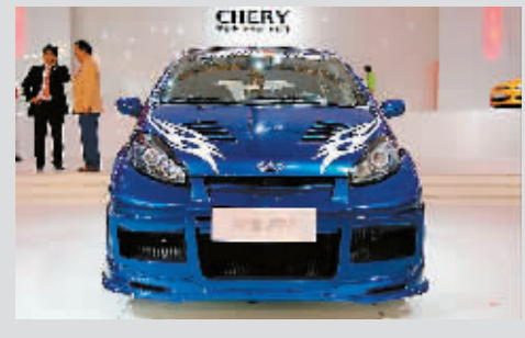
责任编辑 杨斌 版式 夏小凤

奇瑞秋季服务活动的第二响是为所有奇瑞车主免费车辆检测。时间从9月22日到10月9日,从轮胎到底盘再到驾驶室,奇瑞将全车数百个检测点连成数据网,形成更直观、透明的检测结果,不放过任何可能出现问题的细小环节。另有维修保养幸运现金折扣。 记者 刘丽娜