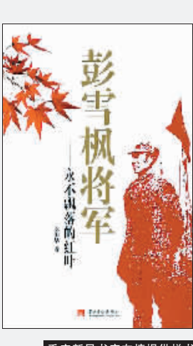
重庆新书书店友情提供样书

欧阳华/著 当代中国出版社出版 今年是彭雪枫将军诞辰100周年,本书为纪念彭将军而作。彭雪枫在少年时刻苦读书和习武,在一次德治豪强后,他远赴他乡求学。投身革命后,他做过秘密工作、工运农运工作、战地工作,后从事军事工作。他参加过土地革命战争时期许多著名战役,在血与火的军事斗争中成长为红军著名将领。抗日战争中,他先后担任新四军第六支队司令员兼政委、八路军第四纵队司令员、新四军第四师师长兼政委。彭雪枫机智勇敢,英勇善战,屡建奇功,留下了一串串光辉的足迹和许多传奇故事。抗战胜利前夕,彭雪枫在一次指挥作战时不幸中弹牺牲,年仅37岁。