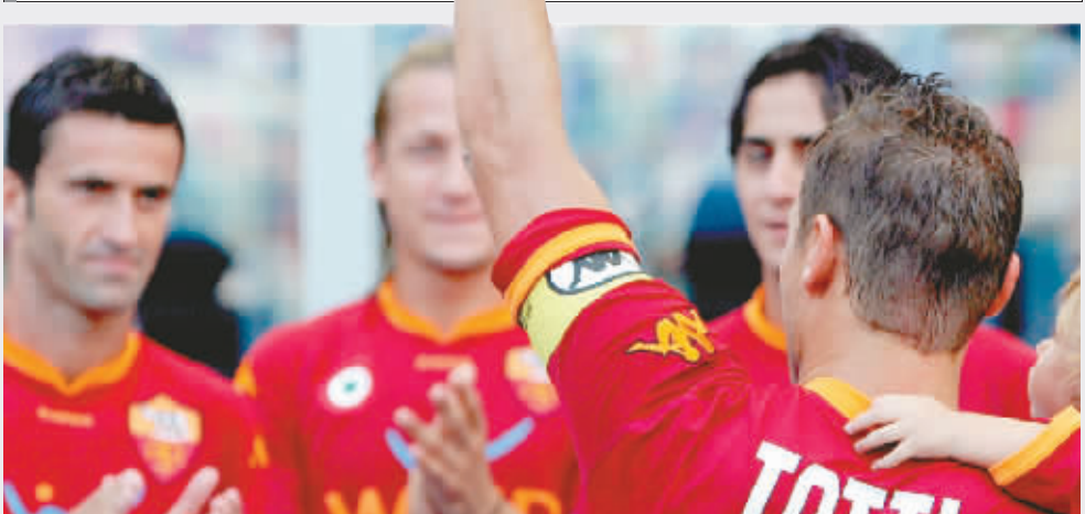
振臂一呼，响应豪门者有多少？

【引子】十天前，意甲五大豪门在意大利联盟的六人委员会选举失败，让人们第一次看到了亚平宁足坛风向转变的可能，但早已习惯了在原有秩序下生存的尤文图斯、米兰双雄、罗马和那不勒斯这五大