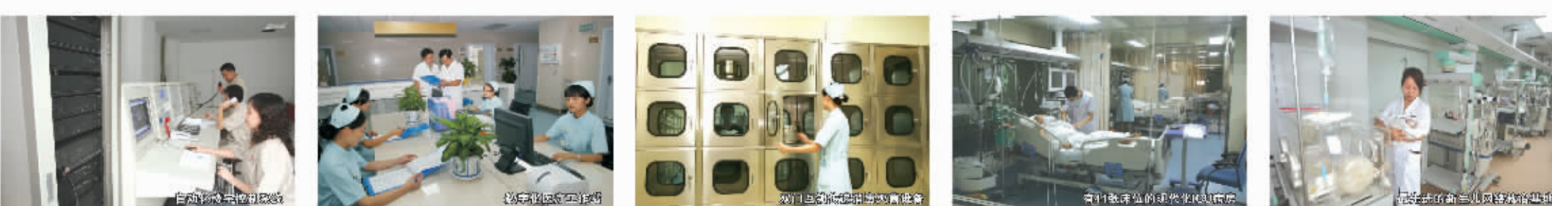
现代化的病房环境、智能化的病房环境、人性化的病房环境、园林化的病房环境

一流的人才、一流的服务、一流的技术、一流的设备、一流的管理、一流的服务“六个一流”为医院全面建设提供支撑。