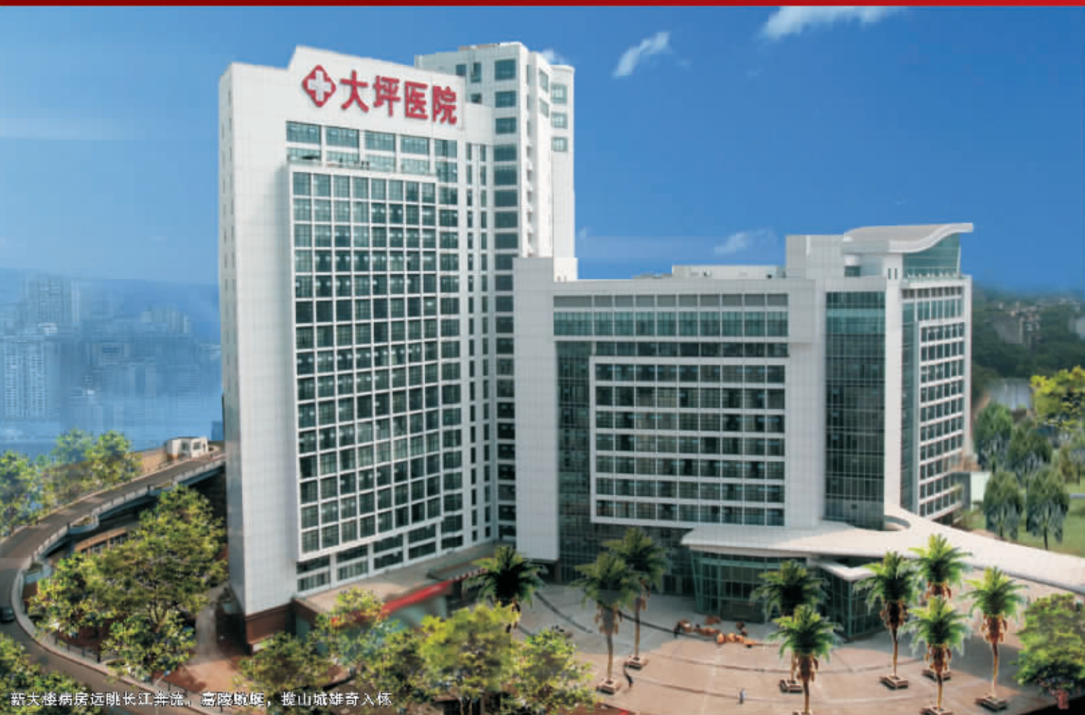
新大楼病房远眺长江奔流，嘉陵蜿蜒，揽山城雄奇入怀