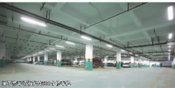
现代化病房宽敞明亮

在我们伟大祖国即将迎来58周年华诞之际，在全国各族人民满怀信心迎接党的十七大胜利召开之时，第三军医大学大坪医院投入近3.9亿元修建的、目前西南地区最大的、功能先进居国内一流水平的单体病房大楼，正式落成启用。这是该院为重庆人民在庆中秋、国庆节佳节献上的一份厚礼。新病房大楼转