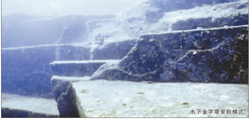
水下金字塔呈阶梯式