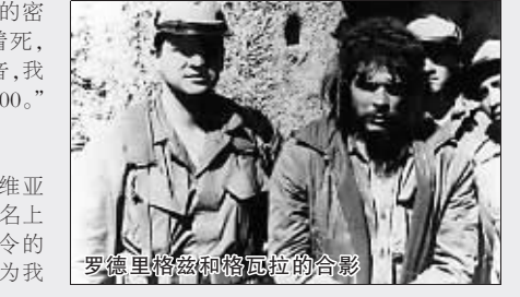
罗德里格兹和格瓦拉的合影

1967年10月8日,遭人告密,切·格瓦拉和他的50名战友在玻利维亚一个小镇附近被捕。在切·格瓦拉被俘期间,时任美国中情局特工的罗德里格兹的任务是负责确保格瓦拉活着,并将他押送到巴拿马受审。 “落魄得像乞丐” 在接受美国广播公司采访时,现年67岁的罗德里格兹表示:“他(格瓦拉)访问过莫斯科也拜访过中国领导人毛泽东,我是从那时开始记得他的。但当年那个穿着制服英姿勃发的人,在我亲眼见到他时却落魄得像乞丐。他衣衫褴褛,脚上的鞋子也不见踪影,一双皮鞋勉强遮住他的光脚。” 格瓦拉坦然赴死 面对这道命令,罗德里格兹与玻利维亚军方的一名上校发生了争执。但当时这名上校回答说:“这是来自我的总统和总司令的命令……你们要对他怎么下手都行,因为我们了解他对你们国家造成的危害。”