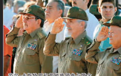
劳尔·卡斯特罗和其他将领参与悼念

生平 ■1928年6月14日,切·格瓦拉生于阿根廷罗萨里奥一个建筑师家庭。 ■1946年至1952年期间,切·格瓦拉就读于大学医学系,获博士学位。期间,他骑摩托车游历南美各国,逐渐萌生通过革命结束贫穷与社会不公的理想。 ■1956年,切·格瓦拉在墨西哥结识卡斯特罗兄弟,1959年与古巴领导人菲德尔·卡斯特罗一起推翻了古巴的独裁政权。古巴革命胜利后,他历任古巴国家银行行长、中央政治局委员和书记处书记等职。 ■1966年,切·格瓦拉放弃职务,率领几十名追随者潜入刚果和玻利维亚,实践其游击中心论和大陆革命计划,两次均遭失败。 ■1967年10月8日,格瓦拉在玻利维亚的拉伊格拉村附近负伤被俘,次日被玻利维亚军人杀害。