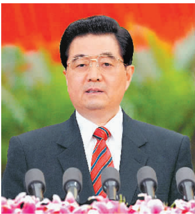
胡锦涛代表第十六届中央委员会作报告