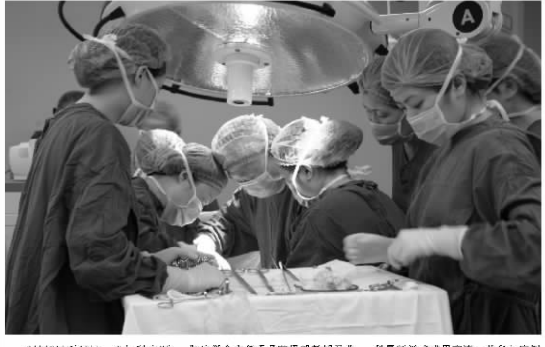
9月17日至18日,“妇科宫颈肿瘤学术交流会”在重庆召开

重点是防止HPV感染 子宫颈是女性内生殖器的一部分,是子宫的开口,是子宫的组成部分,它在完成生殖和生育过程中有着重要的作用。然而,子宫颈也是女性身体最易“受伤”的部位之一。如果感染上细菌、病毒,或是外伤损伤,子宫颈就会因此而发生各种病变,包括炎症、糜烂、息肉、肌瘤等等,是女性最常见妇科疾病之一,其最严重的情况是子宫颈癌。世界每年约有20万妇女死于宫颈癌。 在“妇科宫颈肿瘤学术交流会”上,曹教授明确指出:女性生殖道高危型HPV感染是我国宫颈癌流行的主要危险因素,宫颈肿瘤的防治重点应放在防止HPV感染上。 针对我国目前宫颈癌的情况,曹教授也开出了“良方”他说,人乳头状瘤病毒(HPV)检测和TLT液基细胞学检查是目前有效的宫颈癌筛查手段。特别是生殖道HPV感染的高龄人群18-28岁的女性,应每年做一次液基细胞学检查。 在所有的肿瘤中,宫颈癌是最容易预防的一种,而且宫颈癌的筛查方法也得到了突破。 重庆协和医院率先引进TLT液基细胞学检测系统,开展宫颈癌早期筛查。TLT检测采用高精度过滤膜核心技术,并采用自动化控制系统,其方法制成物细胞膜片明显提高标本的满意率及宫颈异常细胞检出率,同时还避免细胞生物感染如霉菌、滴虫、衣原体等。其采用的一次性宫颈刷取材对宫颈无损伤,且不影响宫颈细胞学检查,且不影响宫颈细胞学检查。 廖素平教授: 宫颈糜烂优先推荐LEEP术 由于炎症刺激,宫颈表面的柱状上皮细胞脱落,而下方的柱状上皮细胞向外突出,代替了脱落的柱状上皮。因柱状上皮的毛细血管丰富,使宫颈区呈鲜红色,故称为“宫颈糜烂”,但并非真性糜烂,而是一种生理现象,并非真性糜烂,而是一种生理现象,并非真性糜烂,而是一种生理现象。