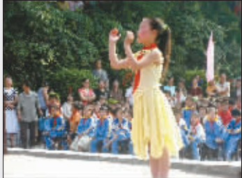
昔日长发的小双在指挥文艺演出