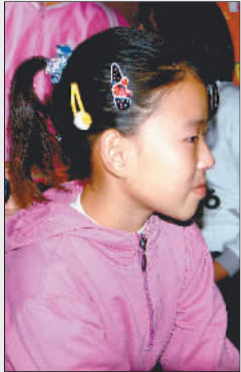
想到无钱给妈妈治病，小双流泪了