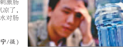
小陈现在看见水就犯晕