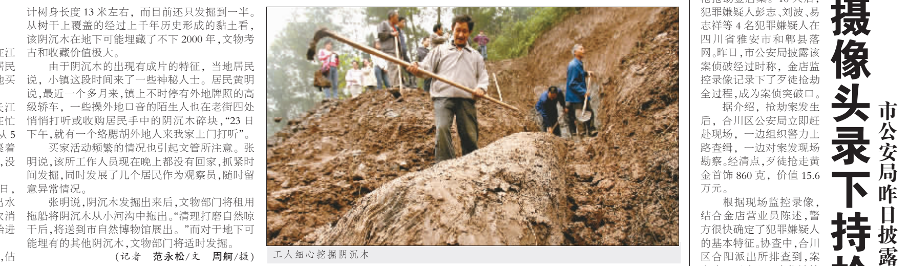
工人细心挖掘阴沉木