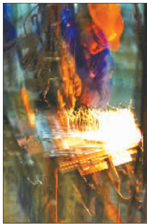
对工作像夏天般火热