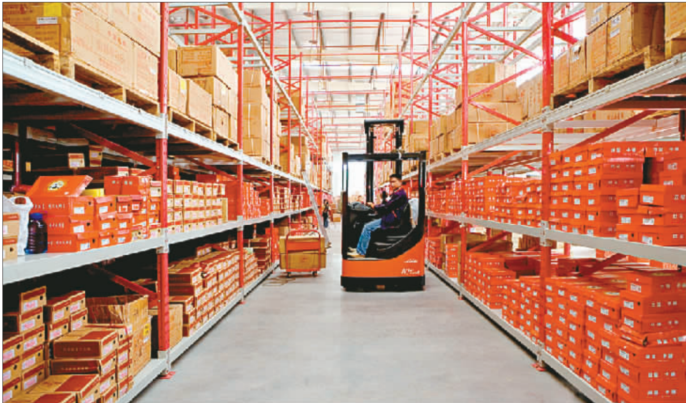
双星集团在重庆的物流中心,数千种产品每天发往各地。