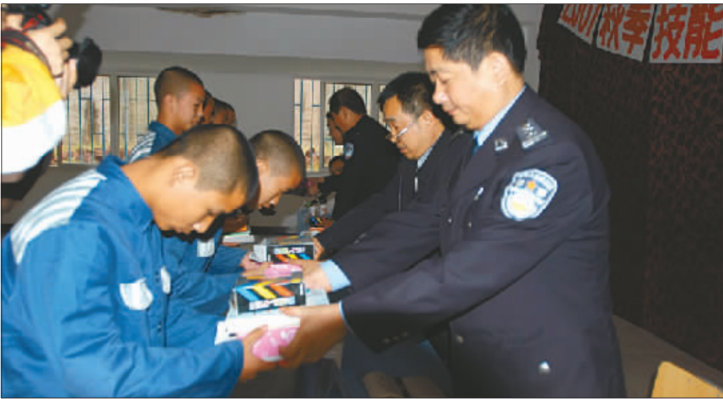
未管所领导为学员颁发维修工具