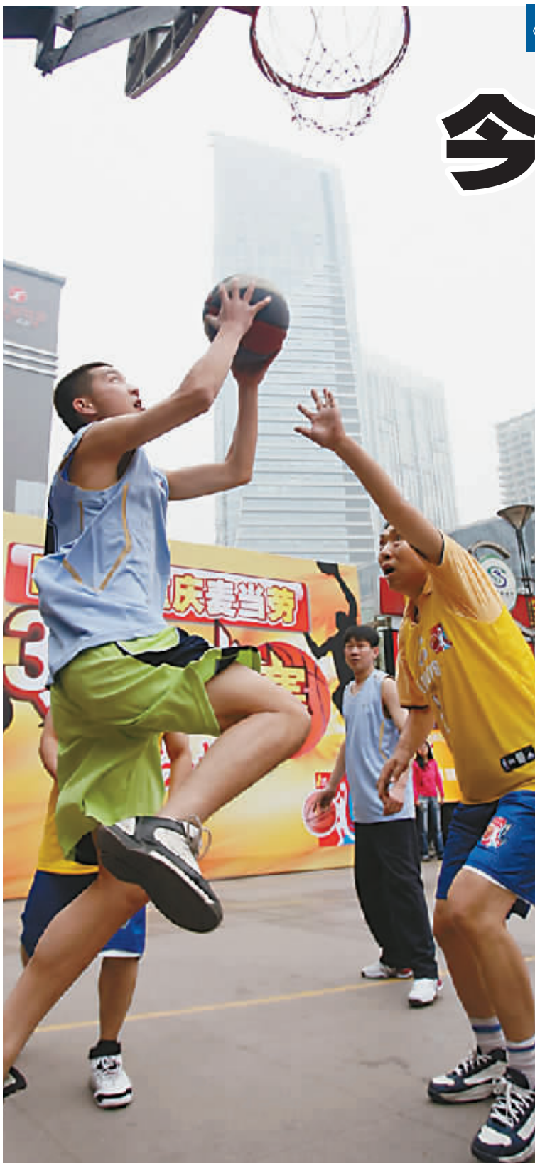
本版稿件由记者 范天亮/文