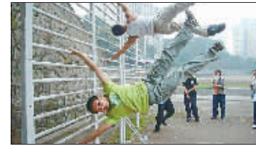
跑酷族在操场上进行各种高难度动作训练

作和技巧，然后聚在一起训练，每完成一个漂亮的动作，都会有一种成就感，心情很愉悦。 “目前，重庆常玩跑酷运动的大约有30人，主要是20岁左右的年轻人和体育学院的学生，该运动既彰显个性又锻炼身体，但也不是人人都适合跑酷运动。”小蒲提醒，“跑酷”动作难度较大，对参与者手部力量、弹跳力和身体柔韧性的要求非常高，一些难度动作甚至有一定危险性，没受过专业训练的人不要盲目模仿。